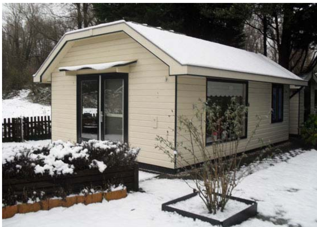
Zomerhuisje aan de Westsingel in de winter! Met dank aan Ap en Bea.

In de wintermaanden zijn de hekken van de hoofdingang van maandag tot en met zaterdag geopend van 9.00 tot 17.00 uur. Op zondagmorgen gaan de hekken om 11.00 uur open. Ze sluiten ook op zondag om 17.00 uur.